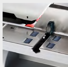
Table de chargement «Heavy Duty». Grâce à l'élargissement de la table de chargement de haute valeur en acier chromé, on peut traiter avec efficacité un volume de courrier de 1000 lettres/jour.

Grâce à l'affichage des marges de la classe tarifaire correspondante, vous voyez en un clin d'œil dans quelle catégorie de poids votre lettre se place.