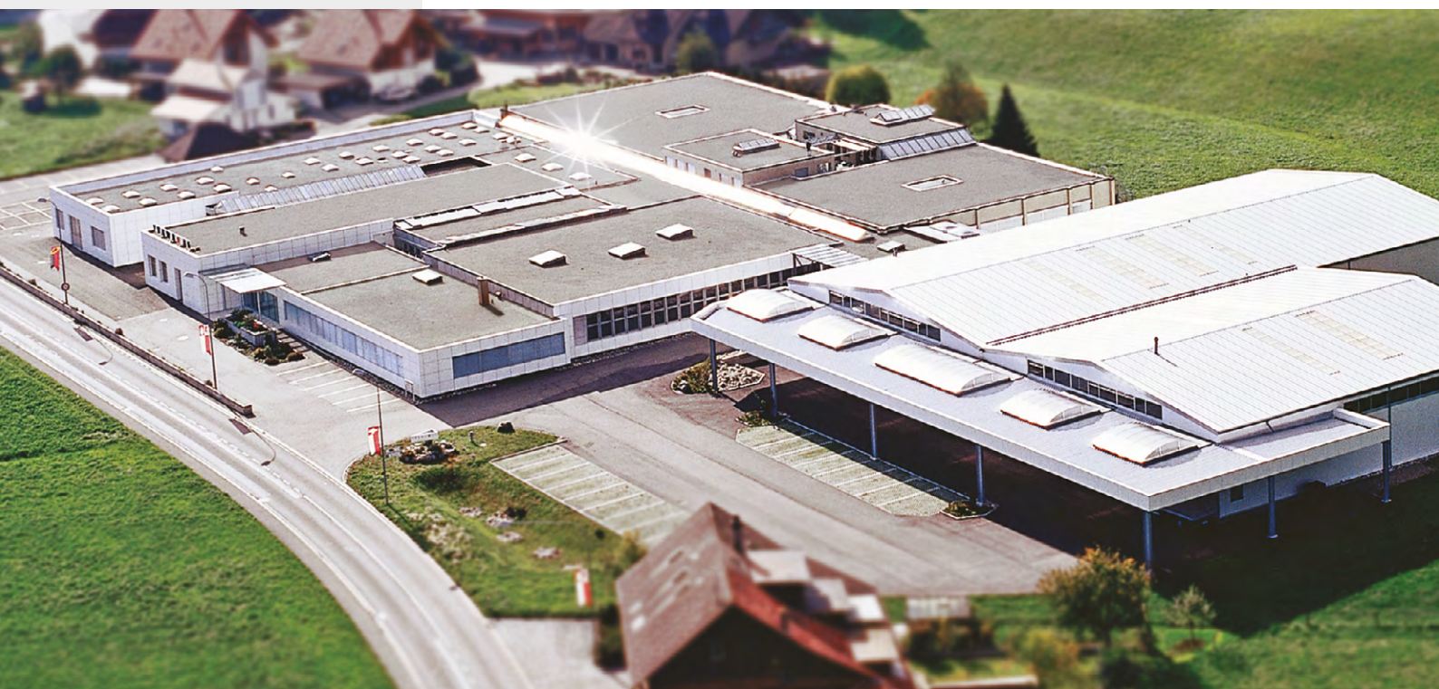
Hauptsitz Frama AG, Lauperswil, mit Entwicklung und Produktion

Frama Suisse AG . Industriestrasse 33 . CH-5242 Lupfig info@frama.ch . frama.ch . Telefon 0848 802 001 . Fax 0848 802 010